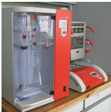
Система анализа азота по Кьельдалю