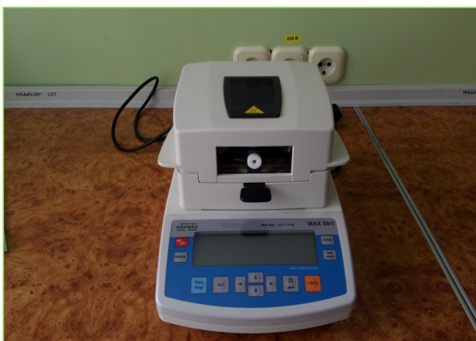
Прибор для определения содержания влаги в продуктах