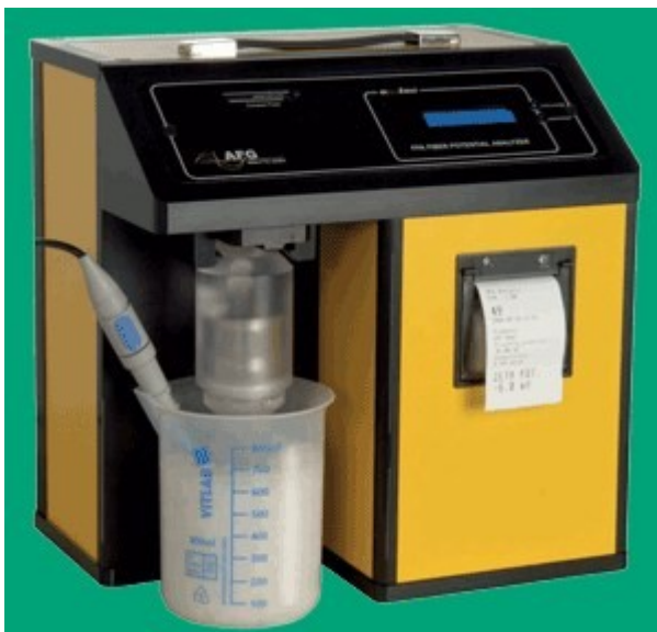
FPA Анализатор дзета-потенциала