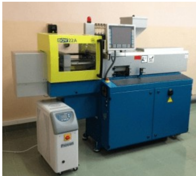
Термопластавтомат Boyu 22A

Были представлены различные презентации о жизни кафедры и наших достижениях. Также были проведены экскурсии по лабораториям с проведением показательных экспериментов.