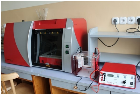
Система для электрофореза белков и нуклеиновых кислот

В биотехнологии и технологии лекарственных препаратов есть по две основные специализации. Технология жиров, эфирных масел и парфюмерно-косметических продуктов и Технология ферментов, витаминов и продуктов брожения для Биотехнологии, Тонкий органический синтез и Промышленная технология лекарственных препаратов в Технологии лекарственных препаратов. Разница в специализациях состоит в подготовке специалистов. У студентов специализации Технология жиров больше предметов, связанных с липидами, например Технология эфирных масел, Технология жиров. У студентов специализации Тонкий органический синтез больше химических дисциплин: химия гетероциклических соединений, анализ органических веществ и др. Важно упомянуть, что специализация не всегда влияет на будущее место работы. Специализация Тонкий органический синтез была создана, чтобы выпускники могли работать в институтах и создавать новые лекарственные препараты. Но если у студентов этой специализации есть желание работать на предприятии, они могут пойти и туда. Также выпускников специальности Биотехнология часто можно увидеть на предприятиях фармацевтической промышленности.