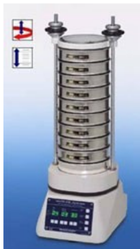
Просеивающая машина HAVER EML 200 digital plus T