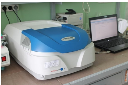
Спектрофотометр двулучевой регистрирующий Specord U200 Plus.