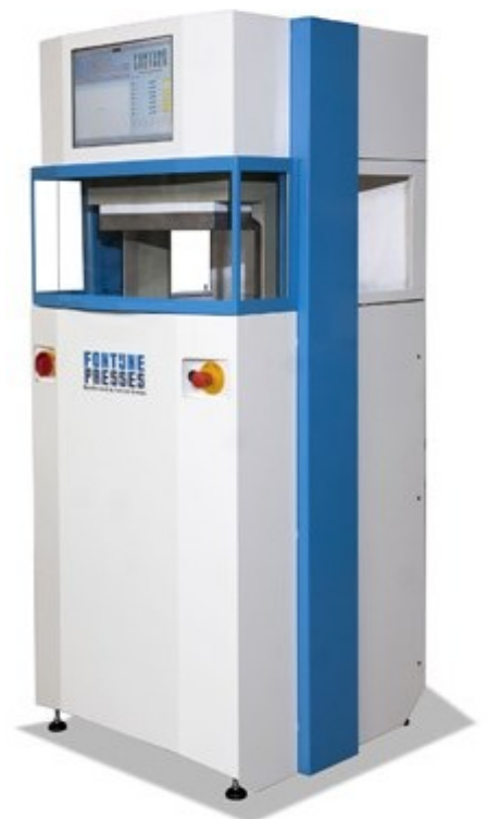
Лабораторный горячий пресс LabEcon300